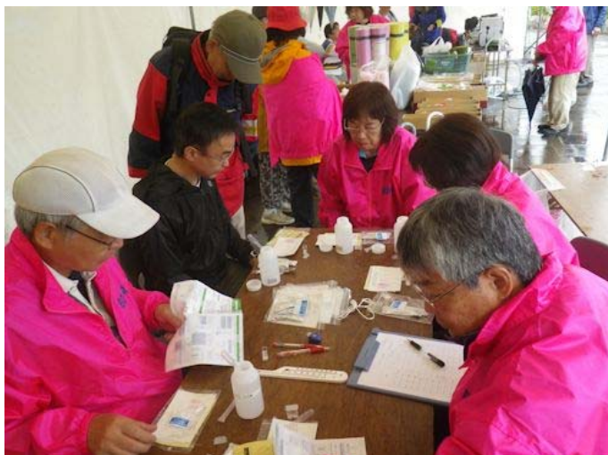
写真左 パックテストの様子 (本部テントにて)