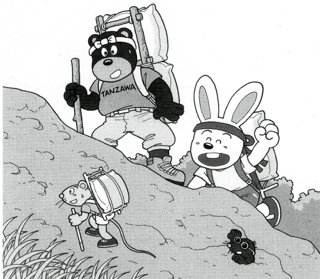
第10回大会イラスト